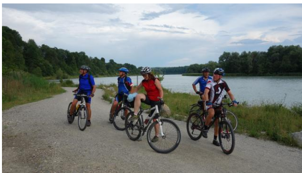
...nach Au am Inn entlang bis Gars