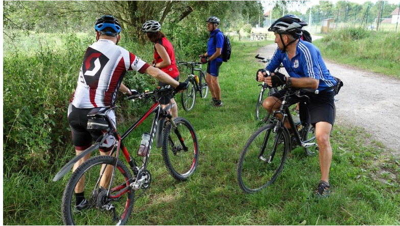
...in Jettenbach bei den Wasserbüffeln