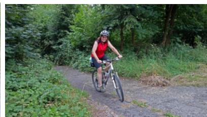
...der Hohlweg nach dem Tierheim zum Föhrenwinkl in Waldkraiburg