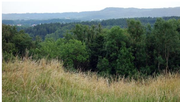
...auf Höhe von Stampfl