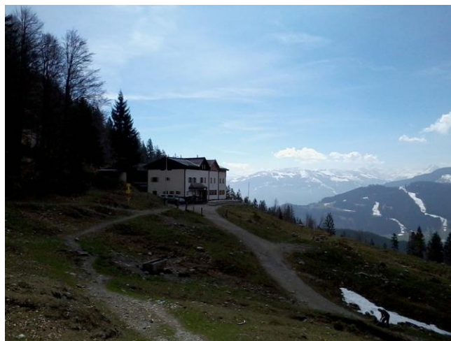
...Blick zurück zur Gaudeamushütte