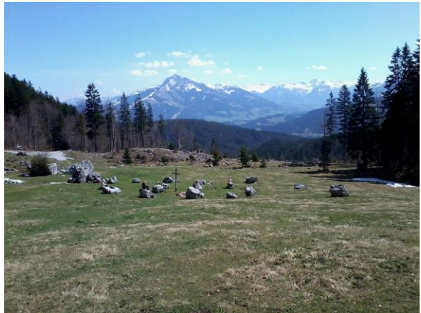
...am Ellmauer Steinkreis