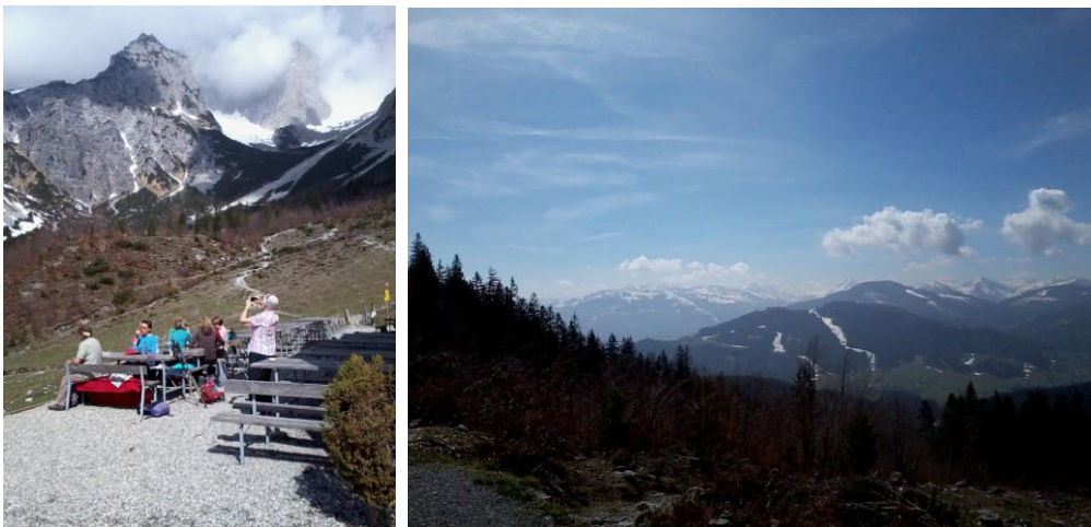
...von der Wochenbrunner-Alm zur Gaudeamushütte

So gestärkt ging es auf dem Forstweg in 20 min. zurück zur Wochenbrunner Alm, die doch schon teilgeöffnet hatte, so dass die Tour am runden Tisch auf grüner Wiese mit einem großartigen Panoramablick gemütlich ausklang und in die Woche gut hinein gestartet werden konnte.