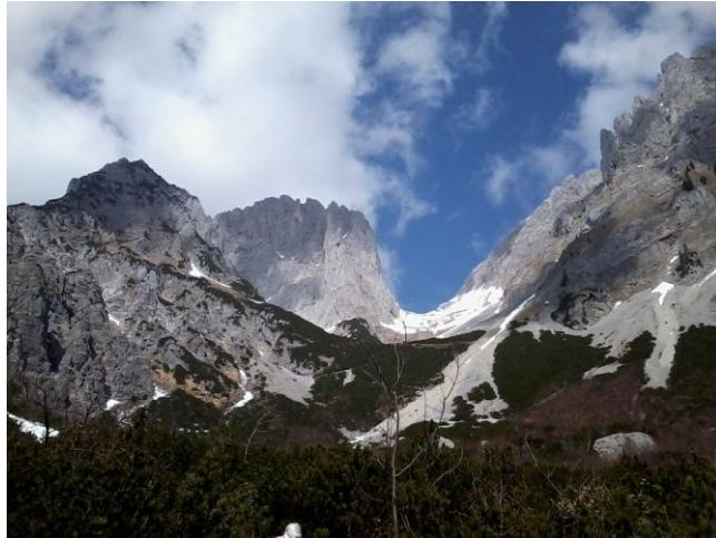
...Blick hinauf zum Ellmauer Tor