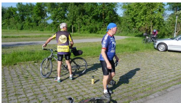
Start in Rohrdorf am Sportplatz

Route: Rohrdorf Sportgeländeparkplatz - Winkl - Anger - Altenbuern - Althaus - Wieling - Saxenkamm - Entleiten - Sachsenkam - Samerberg - Oberleiten - zurück nach Dorfen und auf dem Dandlbergweg zur Dandlbergalm (740 m) - Schilding - Brunn - Anker - Hintersteinberg - Breiten - Zain - rechts ab auf Feldweg zum Badesee in Unterpössnach - auf dem Innradweg bis zur Unterführung bei der A8 - hier nach rechts vorbei am Hochsträßer See - Neunersee nach Winkl - AP Rohrdorf (33 km/500 HM/3 Std.)