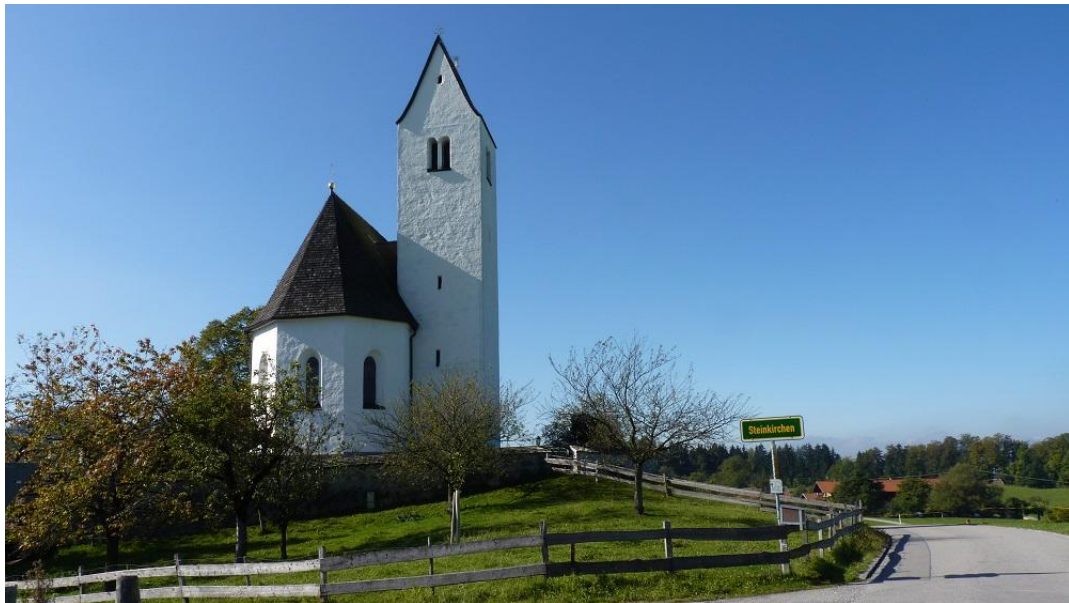
Steinkirchen ...von hier zur Aussichtskapelle