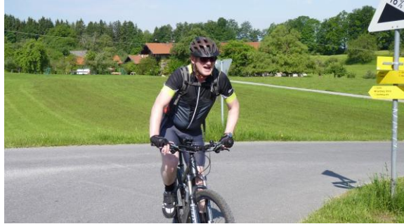
...die steile Auffahrt nach Steinkirchen