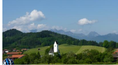
...eine schöne Aussicht von der "Aussichtskapelle"