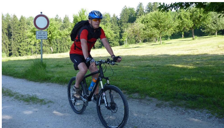
...die Waldauffahrt nach Althaus