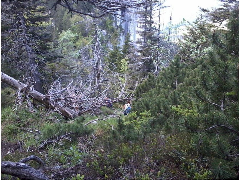
...auf dem Kamm der Gedererwand