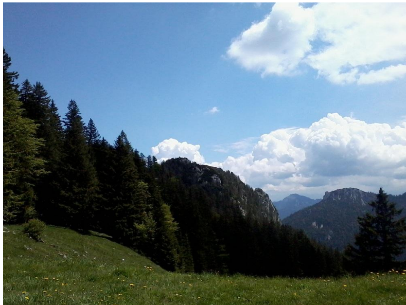
...im Abstieg Blick zurück zur Gedererwand