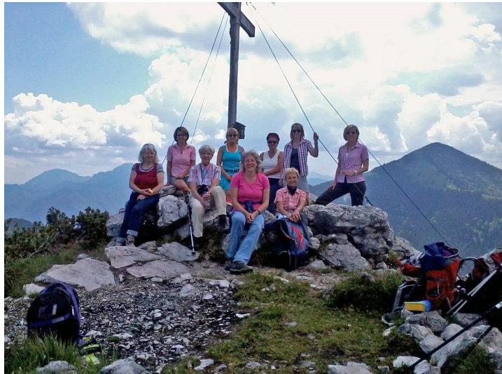
...am Gipfel von der Gedererwand