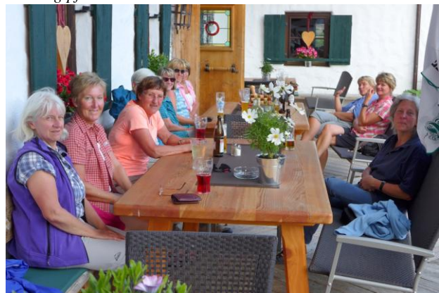
Einkehr in der Stallalm