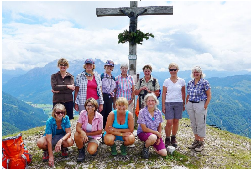
...am Fellhorn Gipfel