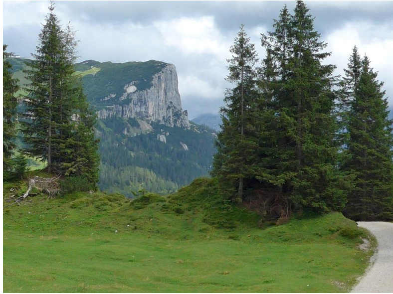
Blick zur Steinplatte