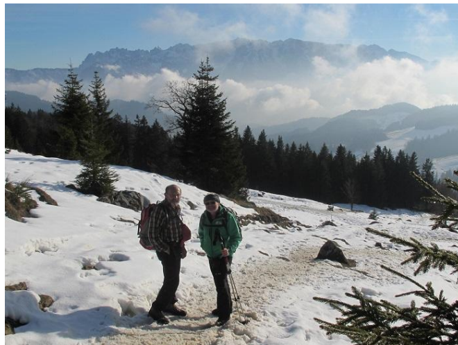
...nur im Gipfelbereich eine dünne Schneedecke