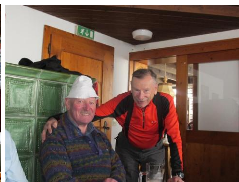
...Einkehr im Spitzsteinhaus... gesellig bei zünftiger Musik