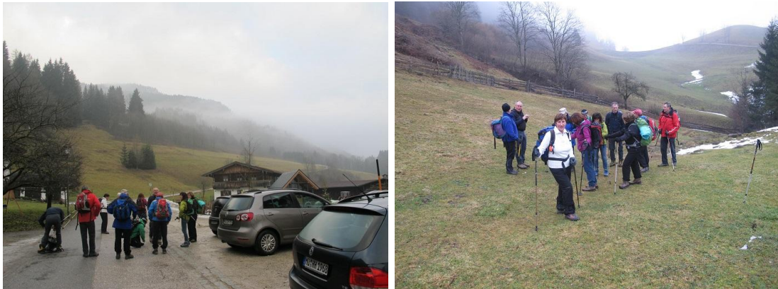
...Aufstieg bei "frühlingshaften" Verhältnissen

Die sonst von der Sektion als Skitourenauftritt geplante Fahrt zum Spitzstein (1596 m) konnte in der 36-igsten Wiederholungsfahrt weder mit Ski noch mit Schneeschuhen durchgeführt werden. Trotz dieser "widrigen Verhältnisse" - kein Schnee, nasse Wege und Nebel - trafen sich zu dieser Traditionsfahrt 32 Teilnehmer. Einige Wanderer ließen es sich nicht nehmen, den 1596 m hohen Spitzstein zu besteigen und wurden überraschend mit einer tollen Aussicht belohnt. Wie üblich gab's eine zünftige Einkehr mit Musik im Spitzsteinhaus. Trotz dieser nicht winterlichen Verhältnisse war es eine gelungene Fahrt.