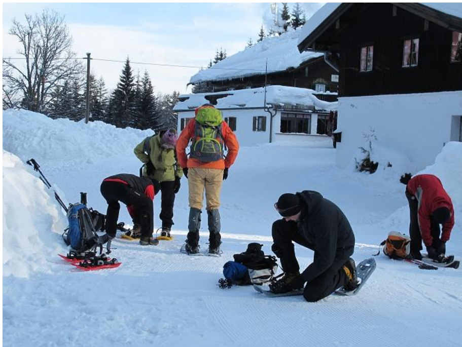
Start der Schneeschuhtour um 10:00 Uhr bei der Hindenburger-Hütte