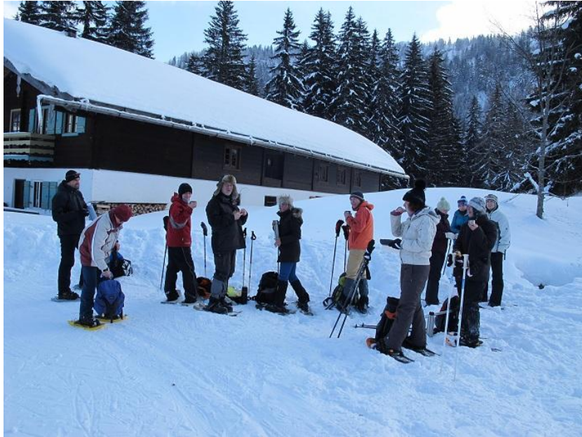
...bei der oberen Hemmersuppenalm