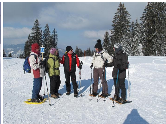
...bereits auf dem Rückweg zur Hindenburger-Hütte, dem Ausgangspunkt der Rundtour