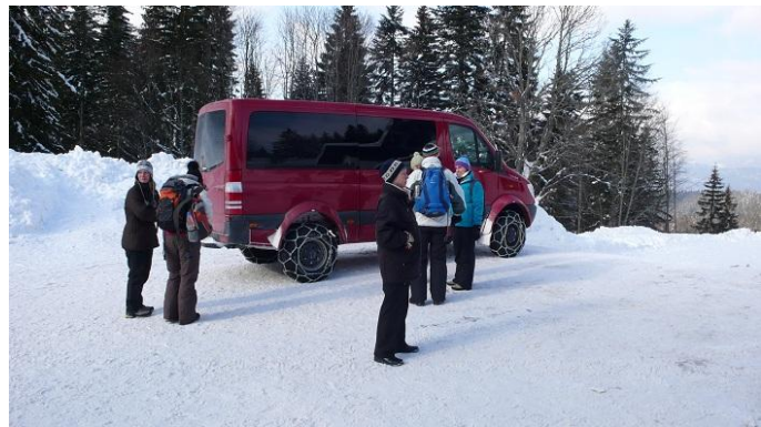
...und von hier mit dem Shuttle-Bus zur Hindenburger-Hütte