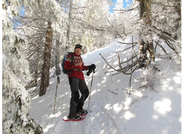
...im letzten Teil des Weges zum Gipfel