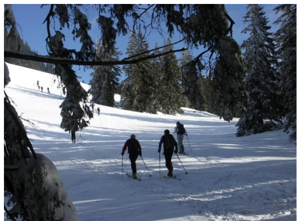
...nach der kurzen Steilstufe durch den Wald über einen freien Hang...