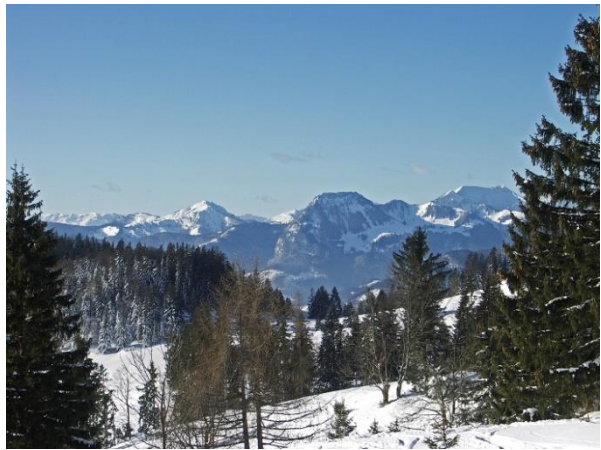
...auf Höhe des Spitzsteinhauses