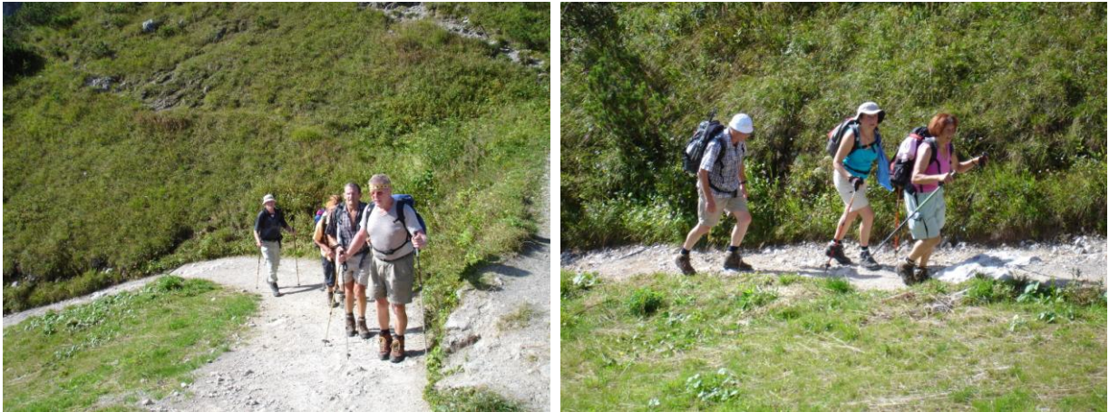
Aufstieg zum Stripsenjochhaus

Der Aufstieg über den Fernwanderweg E4 zum Stripsenjochhaus (1577m) wurde, trotz der schon hohen Temperatur von allen in eineinhalb Stunden geschafft. Auf dem Stripsenjochhaus wurde dann eine längere Rast mit erfrischenden Getränken eingelegt, bevor die letzten 230 Hm zum Stripsenkopf (1807m) in Angriff genommen wurden. Nach kurzer Rast ging es weiter über den Tristecken (1710m) zum Feldberg (1813m). Hier wurde eine längere Brotzeitpause eingelegt, bevor der Abstieg zur Ranggenalm (1229m) erfolgte. Von dort ging es nach kurzem Aufenthalt weiter zum Ausgangspunkt.