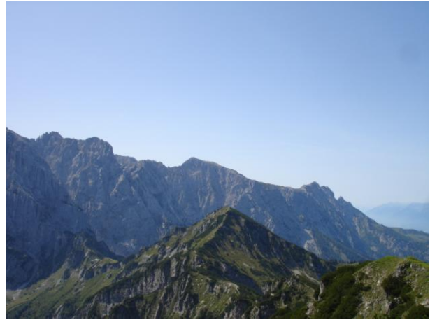
Bei der Brotzeit auf dem Feldberg mit Aussicht auf das Sonneck